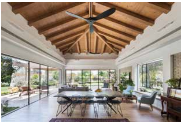
מבט לחלל חדר אוכל סלון בסביון.

עם הפונקציונליות. "אדריכלות זה לא מקצוע סוציאלי", אומר גל, "תפקידה לעשות טוב לאנשים. הניסיון והידע מאפשרים לנו לטפל היטב בתפר שבין הפונקציה לעיצוב. אנחנו יושבים עם הלקוח ומסביימים מה החשיבה שהובילה לתכנון, ותמיד מגשימים את החלום!".