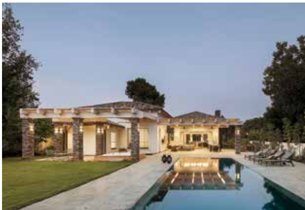
בית בהוד השרון.